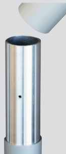
Steckstoß Z75, Z90, 2-teilig